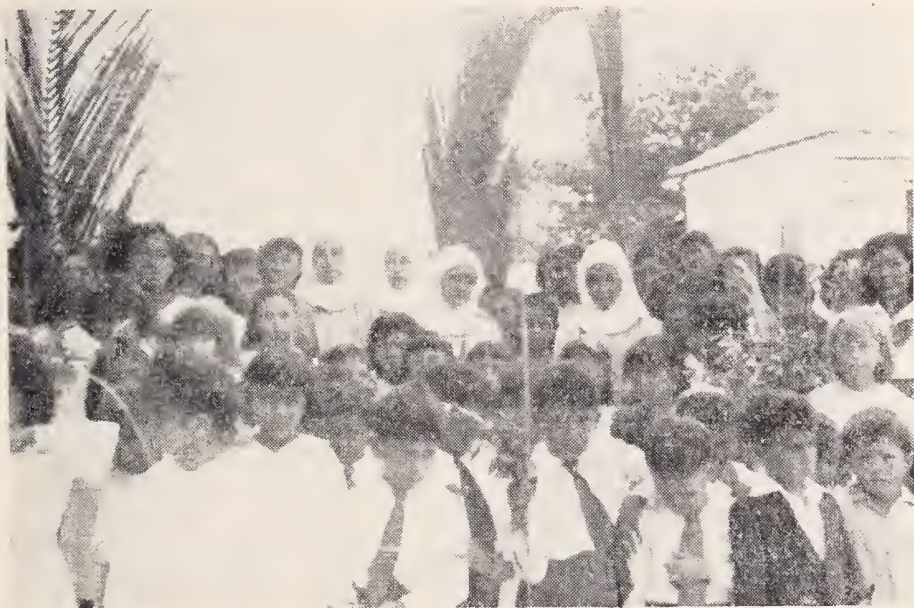
Sinamaica.—Grupo de niños y niñas a la salida del Templo el día Domingo de Ramos, acompañados de las Hermanas Misioneras.

En la última Hora de Adoración, que se hizo por la noche, transmitida por el micrófono, la Iglesia resultó incapaz de contener tanta gente... EL MONUMENTO fué algo sorprendente aún para los de gusto más refinado... Ifubo además otro monumento doloroso re-